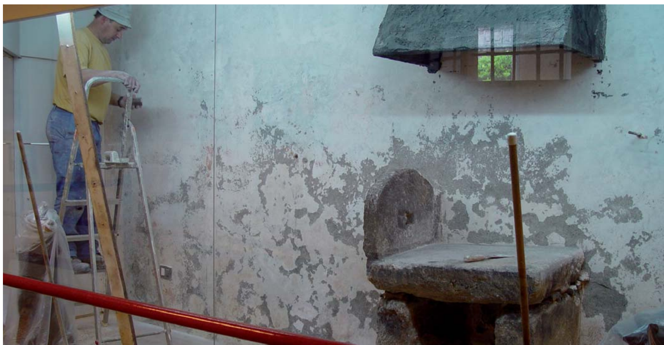
Obras no módulo de Ferreiros e Ferradores

No mes de agosto principiou a execución dun conxunto de obras de reparación e mellora en diversas salas do Museo. O paso do tempo vai deixando a súa pegada naquelas instalacións máis antigas, que dan mostras do deterioro producido polo uso e polas condicións estruturais e ambientais que fan necesario someter o histórico edificio do antigo convento dominico de Bonaval a traballos sistemáticos de mantemento.