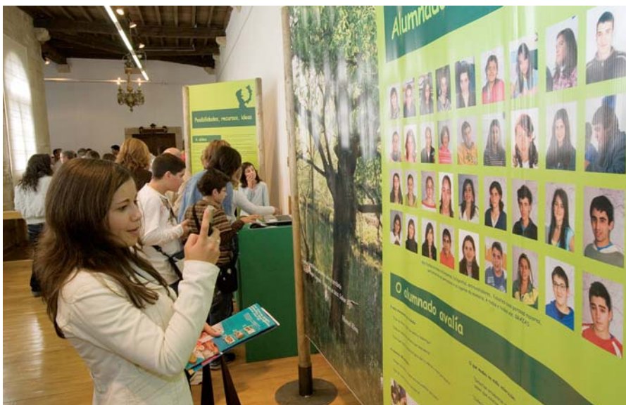
Exposición do Proxecto didáctico 2007.