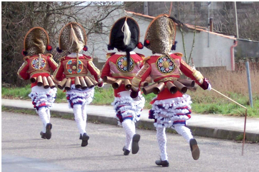
Entre amig@s 2007.

Esperamos a vosa participación e anticipamos o agradecemento a todos os que decidades colaborar.