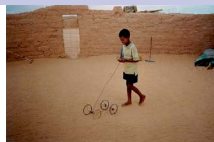
Un deserto de flores

Por terceiro ano consecutivo, o Departamento de Educación e Acción cultural do Museo, en colaboración coa comarca de Sobrarbe, organizadora do festival de cinema etnográfico Espiello , organiza a Mostra de Cinema documental etnográfico entre os días 31 de outubro e 6 de novembro. Esta actividade conta co patrocinio da Concellería de Cultura de Santiago de Compostela.