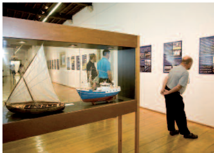
Exposición da 5ª edición do Proxecto Didáctico Antonio Fraguas.

O 11 de outubro, coincidindo co acto inaugural das exposicións correspondentes á 5ª edición do proxecto didáctico Antonio Fraguas, fíxose entrega do premio aos seleccionados na 6ª edición.