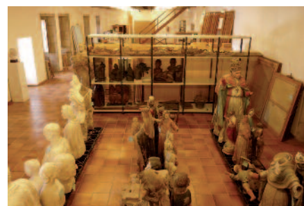
Unha das salas de reserva, despois da reorganización

Minerva e Marte. O Batallón Literario de 1808 , organizada pola Universidade de Santiago