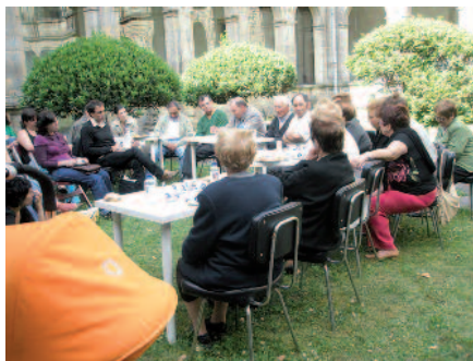
Unha sesión do Café da Memoria, no xardín do claustro

■ III Mostra de cinema etnográfico : por terceiro ano consecutivo celebrouse a Mostra que comezou o día 31 de outubro coa preestrea do documental