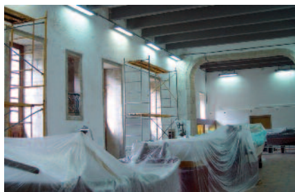
A sala do Mar foi unha das sometidas a obras de mantemento e mellora

Durante os meses de agosto a outubro fixéronse obras de reparación e mellora en diversas salas. A intervención dos Departamentos de Conservación, Exposicións e Mantemento, que afecta tanto ás condicións das salas como dos fondos expostos nas salas de oficios situadas na planta baixa e na entreplanta