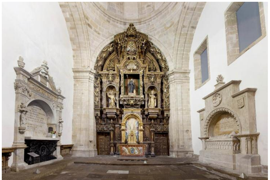
Panteón de Galegos Ilustres

Renovando o acordo do 20 de decembro de 2008 acordando iniciar “sondeos escalonados co Consello da Cultura Galega, a Real Academia Galega e os padroados e fundacións relacionadas co Panteón sobre a conveniencia de realizar