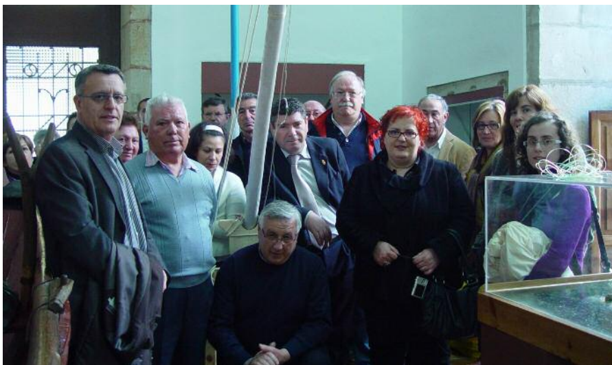
A delegación burelá na sala do Mar, no acto de entrega da reprodución da vara boniteira.

Fíxose constar en acta o agradecemento ao Concello de Burela, a Confraría de Pescadores e o grupo de xubilados do mar "A Moncloa", pola doazón dunha reprodución dunha vara boniteira, entregada ao Museo o